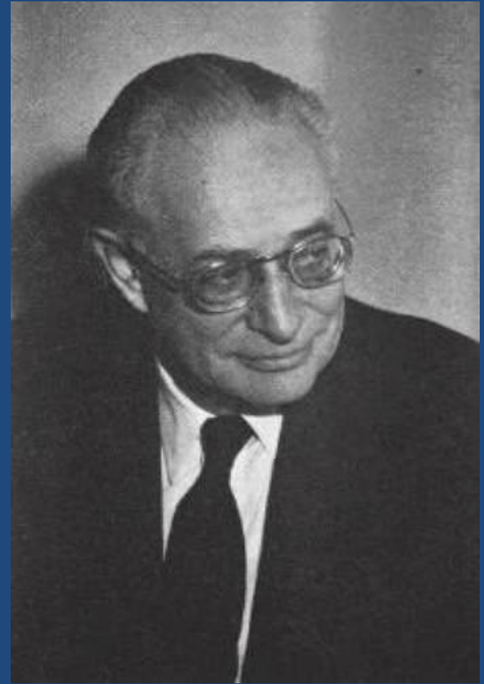
М. Балинт (1896-1970)

Актуальность: Предотвращение профессионального выгорания медицинского персонала психиатрического профиля является важной задачей при решении проблемы оказания качественной помощи пациентам психиатрических стационаров. Для профилактики профессионального выгорания с 1950-х годов используется метод Балинтовских групп, и он не утратил актуальности и сейчас, и применяется не только в профилактике сформировавшейся профессиональной деформации, но и при обучении. Балинтовские группы – это метод групповой тренинговой исследовательской работы.